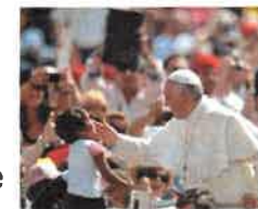
La joie de l'évangile Exhortation apostolique

1. La joie de l'Évangile remplit le cœur et toute la vie de ceux qui rencontrent Jésus. Ceux qui se laissent sauver par lui sont libérés du péché, de la tristesse, du vide intérieur, de l'isolement. Avec Jésus Christ la joie naît et renaît toujours.