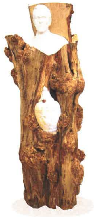
Reliquaire du cœur « L'Arbre et ses fruits » Chapelle du Prado - Lyon

Ensuite, les reliques nous rappellent une vérité chrétienne fondamentale : depuis le jour de son baptême, le chrétien est devenu un « temple de l'Esprit Saint », il est « habité par Dieu ». « Le corps de l'homme participe à la dignité de l'« image de Dieu » : il est corps humain précisément parce qu'il est animé par l'âme spirituelle, et c'est la personne humaine tout entière qui est destinée à devenir, dans le Corps du Christ, le Temple de l'Esprit. (Catéchisme de l'Église Catholique, n°364). Ce qui distingue un chrétien, c'est qu'il est habité par l'Esprit Saint.