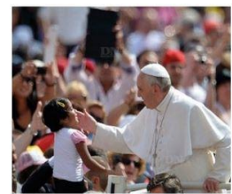
La joie de l'évangile Exhortation apostolique

Dans son exhortation apostolique 'La joie de l'Évangile', le pape François invite toutes les communautés chrétiennes à un renouveau ecclésial qui passe par « le chemin d'une conversion pastorale et missionnaire » La joie de l'Évangile (EG) § 25 . Il s'agit de faire en sorte que « la pastorale ordinaire en toutes ses instances soit plus expansive et ouverte, qu'elle mette les agents pastoraux en constante attitude de "sortie" et favorise ainsi la réponse positive de tous ceux auxquels Jésus offre son amitié. » EG § 27